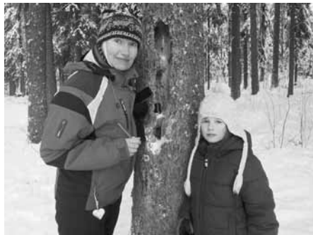
Kirppa11 ja Elsa kätköllä

Itse sain tutustua lajiin reilu vuosi sitten Kaamosyöpymisretkellä. Retken yhtenä aiheena oli geokätköily. Kuuntelin paikallisten harrastajien esitelmää aiheesta ja mietin, että tuo voisi olla minunkin lajini. Kävimme maastossa ja löysimmekin useamman kätkön. Kuin lapset avaimen piilotusleikissä kyykistelimme porukalla eräänkin laavun ympäröstössä ennen kuin joku vihdoin löysi kätköpurkin penkin alle poratusta reiästä! Ovelaa! Mahtavaa löytämisen riemua!