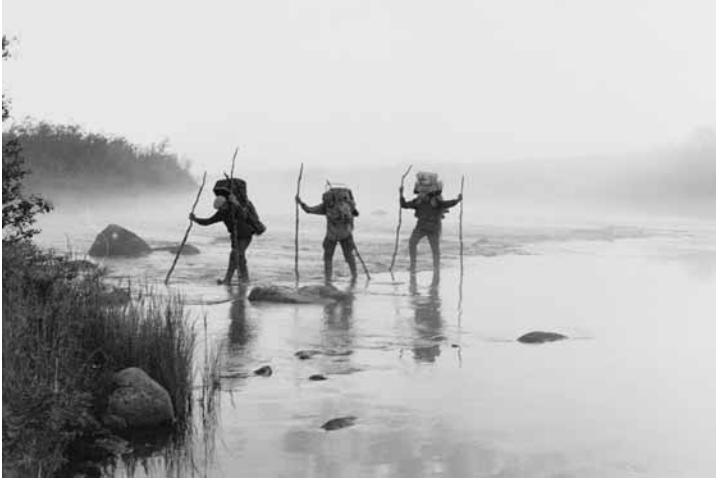
Joen ylitys Inarijoella

sentään kaksi autiotupaa: Andreas Nilsenin ahavoitunut hytta puiston itäisimmässä kolkassa, vajaa kilometri puiston ulkopuolella liki Inarijokea ja punainen kirkkotupa Beaivvasgieddin kappelin naapurissa. Karttojen tupamerkintöihin ei kannata liiakoja luottaa, esimerkiksi Ahkkanas Ödestue on yhä kartalla, vaikka se on purettu liki 30 vuotta sitten. Hyvä suunnistus- ja reitinlukutaito ovat tarpeen, sillä kulkumaasto vaihtelee erinomaisesta erittäin vaikeaan ja kartat ovat norjalaiseen tapaan harvakäyräisiä ja muutenkin melko suurpiirteisiä. Paras kulkukartta on 1:50000 lehdet, joita voi kysellä mm. Maanmittauslaitoksen karttamyynnistä. Kannattaa käydä myös osoitteessa www.finn.no/kart (flyfoto).