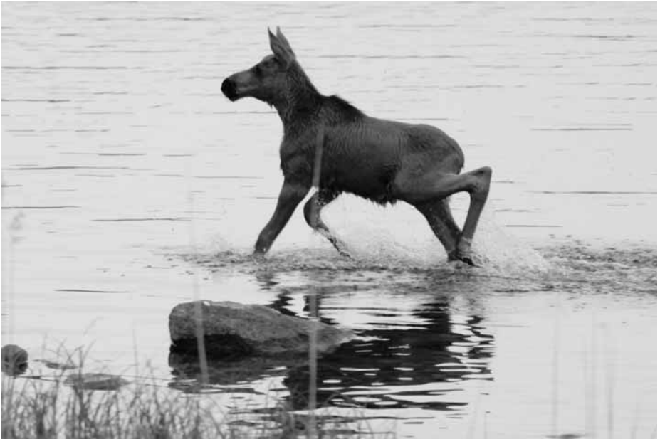
Hirven vasa kesällä 2011.