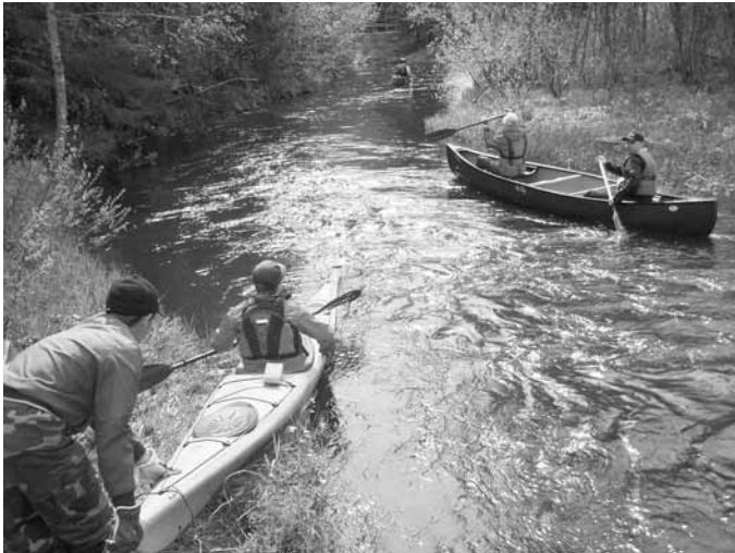
Suihkolanjoella 2011.

Lisätiedot ja ilmoittautumiset: Antti Luoranen, luoranen@luukku.com , puh. 040 539 4767. VT 1