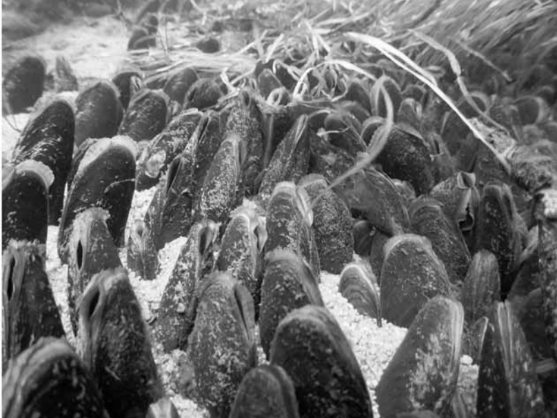
Raakkuja joen sorapohjalla

isuus sitäkin vakaampaa. Asetutaan vuosikausiksi, jopa kymmeniksi, sopivan kiven kupeeseen puoliksi soraan kaivautuneena. Virta tuo hapen ja planktonin suoraan suuhun, mikäpä siinä on kuorta raotellessa.