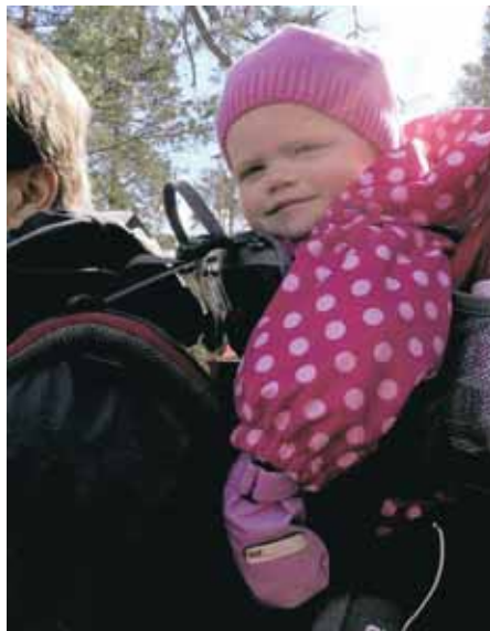
Luontoretkillä viihtyy koko perhe